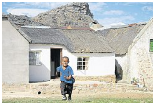
Le village de 19 e siècle n'a pas changé.