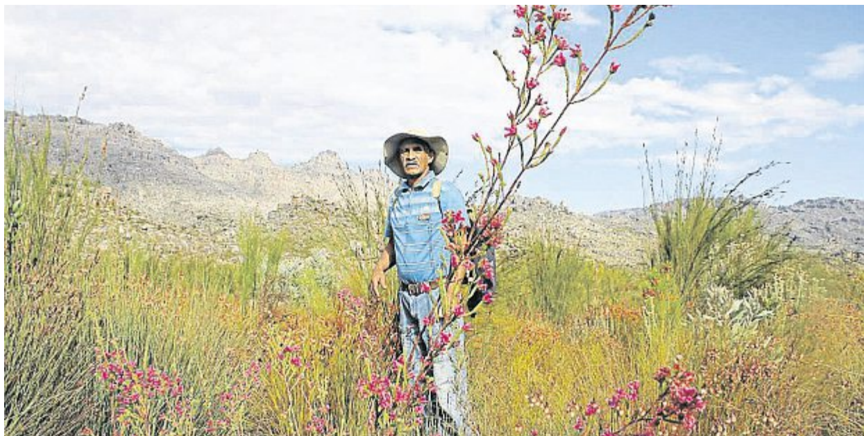
Le paysage est égayé, au printemps, par de superbes tapis de fleurs.