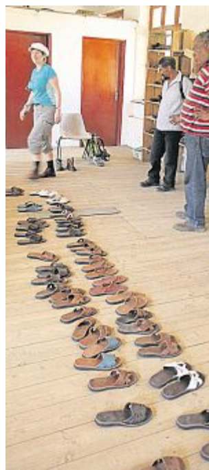
Les randonneurs hébergés dans les villages.