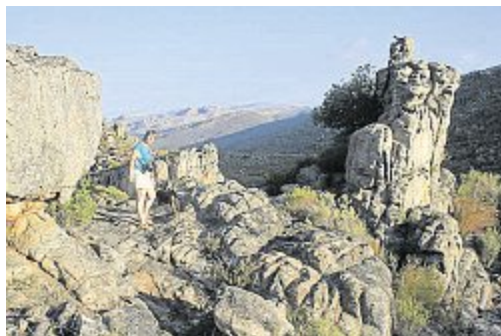
La chaîne de Cederberg.